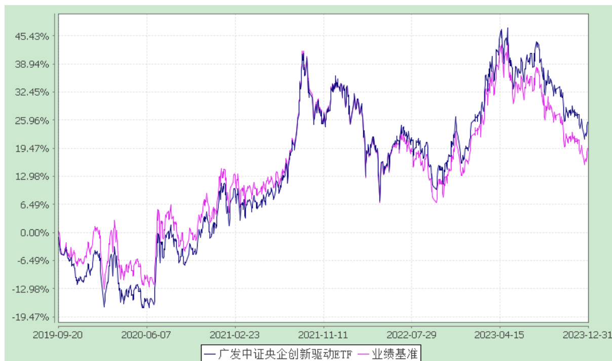
广发中证央企创新驱动交易型开放式指数证券投资基金 份额累计净值增长率与业绩比较基准收益率的历史走势对比图 (2019年9月20日至2023年12月31日)