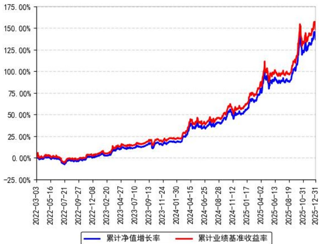
南方上海金ETF累计净值增长率与同期业绩比较基准收益率的历史走势对比图