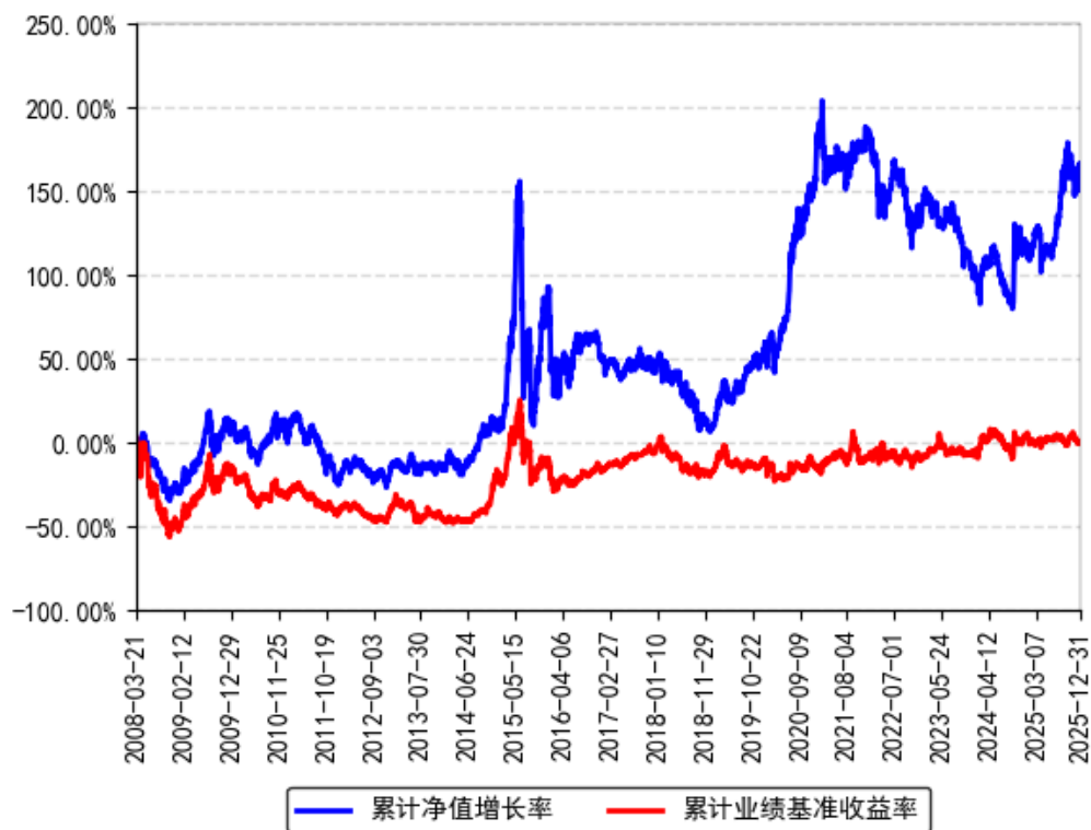
南方盛元红利混合累计净值增长率与同期业绩比较基准收益率的历史走势对比图