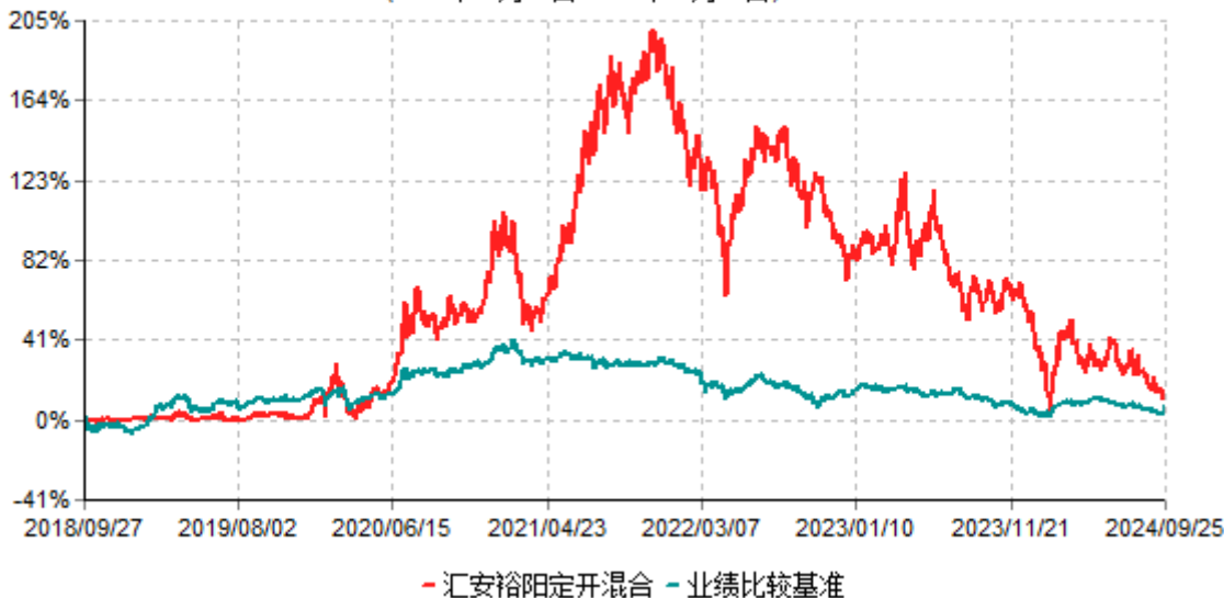
汇安裕阳定开混合累计净值增长率与业绩比较基准收益率历史走势对比图 (2018年09月27日-2024年09月25日)