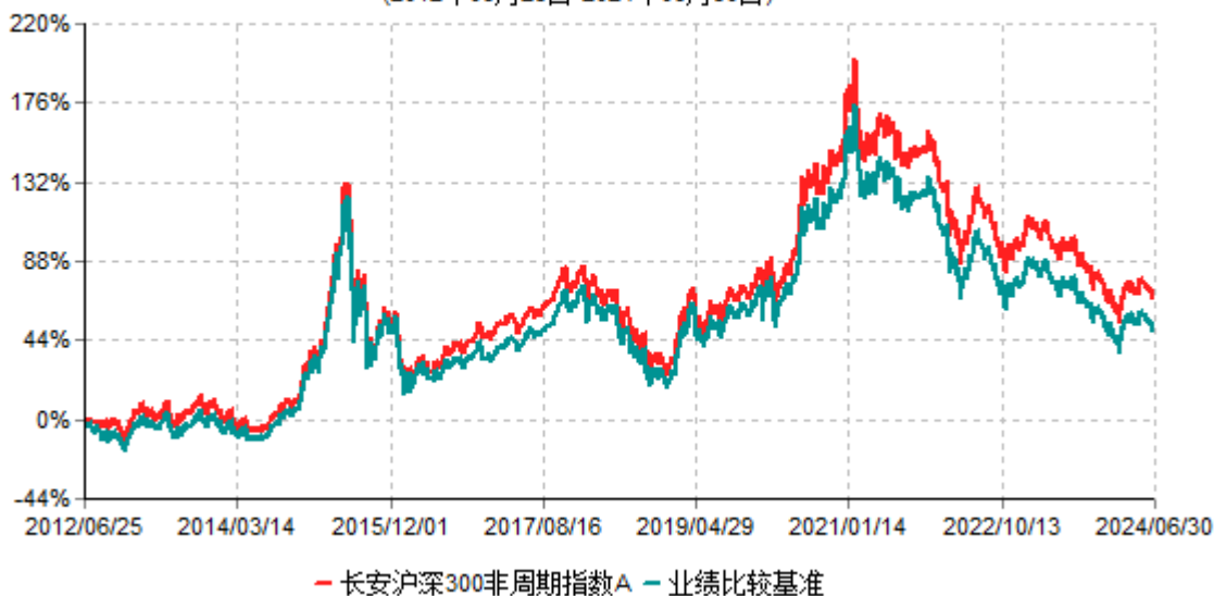
长安沪深300非周期指数A累计净值增长率与业绩比较基准收益率历史走势对比图 (2012年06月25日-2024年06月30日)

根据基金合同的规定,自基金合同生效之日起 6 个月内基金各项资产配置比例需符合基金合同要求。本基金在建仓期结束后,各项资产配置比例已符合基金合同有关投资比例的约定。基金合同生效日至报告期期末,本基金运作时间超过一年。图示日期为 2012 年 6 月 25 日至 2024 年 6 月 30 日。