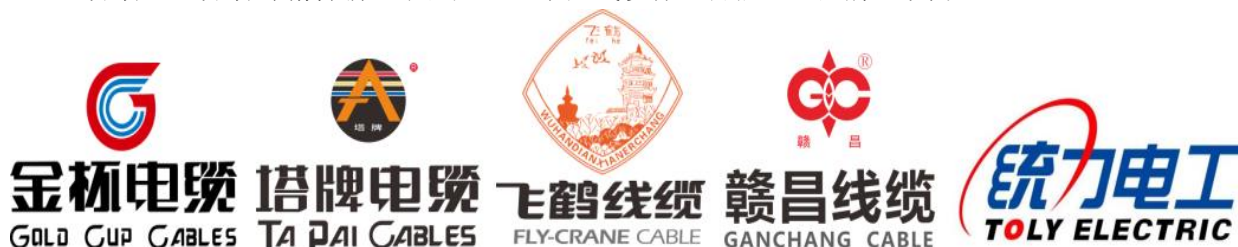
图：1-3 公司旗下扁电磁线及线缆品牌

品牌的形成是长期的点滴积累，需要从质量、价格、服务等方面赢得消费者的良好口碑，这是进入电线电缆行业的壁垒，也是公司拥有的一笔宝贵的无形资产。公司各大品牌在各区域市场具有极强的号