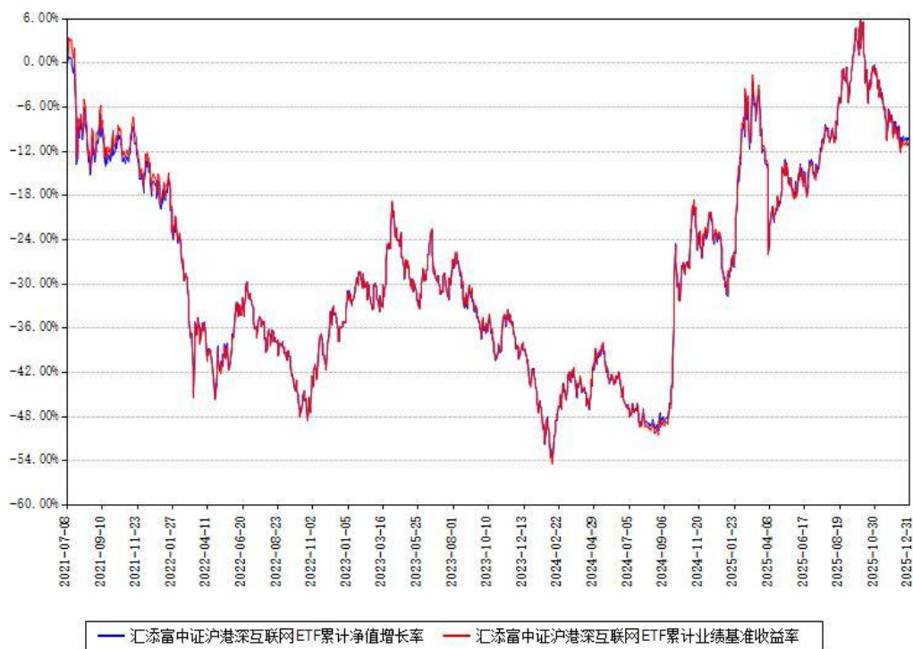
汇添富中证沪港深互联网ETF累计净值增长率与同期业绩比较基准收益率对比图

注：本基金建仓期为本《基金合同》生效之日（2021年07月08日）起6个月，建仓期结束时各项资产配置比例符合合同约定。