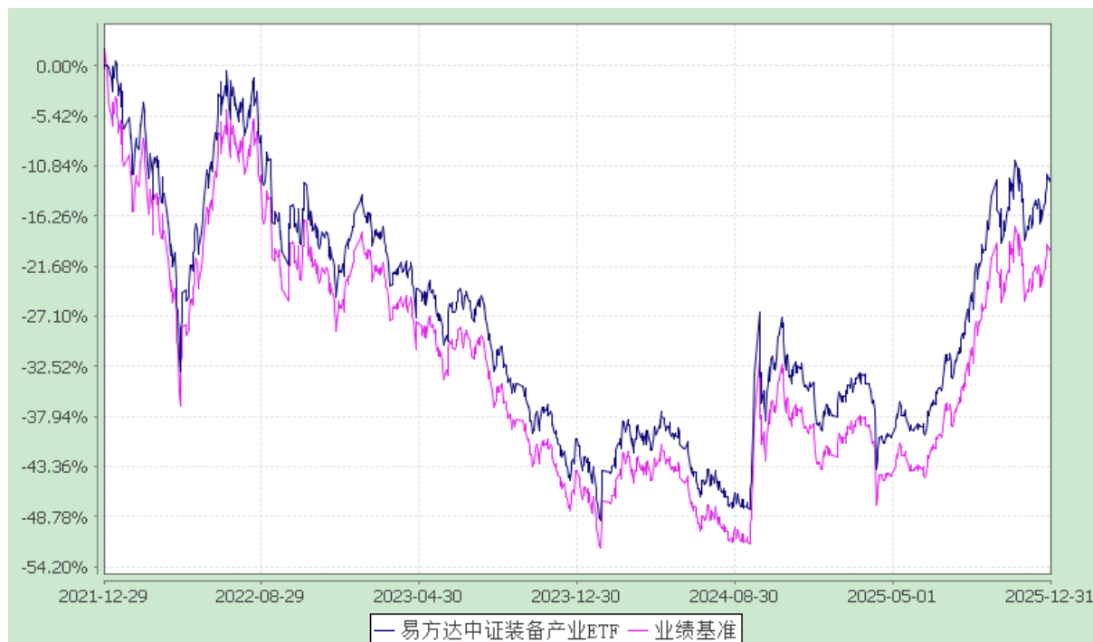
易方达中证装备产业交易型开放式指数证券投资基金 份额累计净值增长率与业绩比较基准收益率历史走势对比图 (2021年12月29日至2025年12月31日)