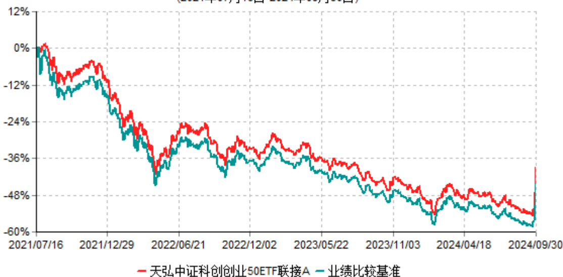
天弘中证科创创业50ETF联接A累计净值增长率与业绩比较基准收益率历史走势对比图 (2021年07月16日-2024年09月30日)