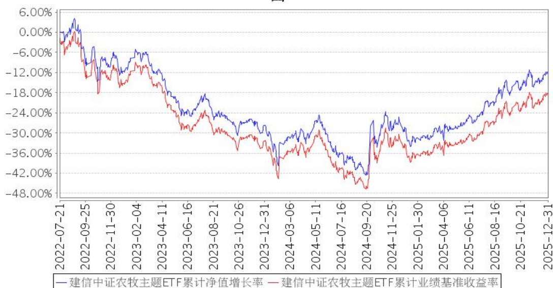
建信中证农牧主题ETF累计净值增长率与同期业绩比较基准收益率的历史走势对比图