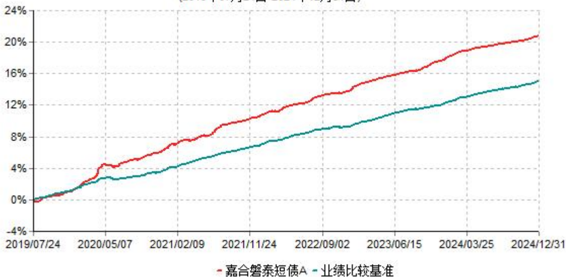
嘉合磐泰短债A累计净值增长率与业绩比较基准收益率历史走势对比图 (2019年07月24日-2024年12月31日)