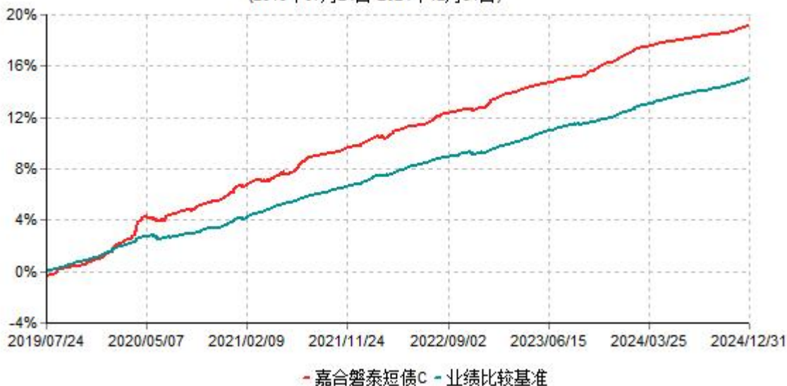
嘉合磐泰短债C累计净值增长率与业绩比较基准收益率历史走势对比图 (2019年07月24日-2024年12月31日)