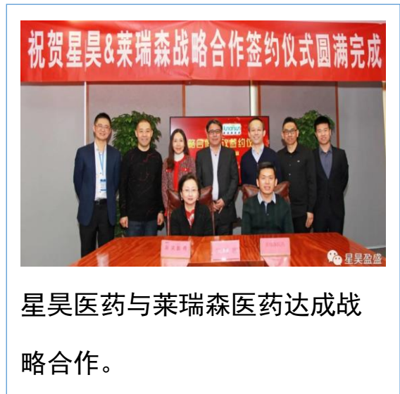
星昊医药与莱瑞森医药达成战略合作。

2022年6月16日北京星昊收到北京证券交易所出具的公司向不特定合格投资者首次公开发行股票并上市的申请《受理通知书》。 广东星昊于2022年3月10日至18日接受了波兰国家药品监督检查局（Chief Pharmaceutical Inspector）对广东星昊终端灭菌小容量注射剂生产线的GMP检查。