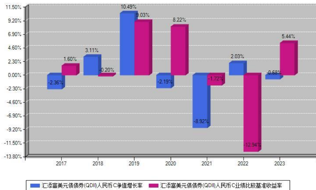
汇添富美元债债券(QDII)人民币C每年净值增长率与同期业绩基准收益率对比图

注：数据截止日期为2023年12月31日，基金的过往业绩不代表未来表现。本《基金合同》生效之日为2017年04月20日，合同生效当年按实际存续期计算，不按整个自然年度进行折算。