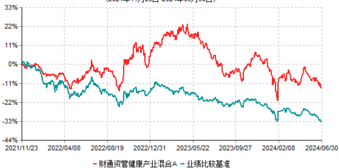
财通资管健康产业混合A累计净值增长率与业绩比较基准收益率历史走势对比图 (2021年11月23日-2024年06月30日)