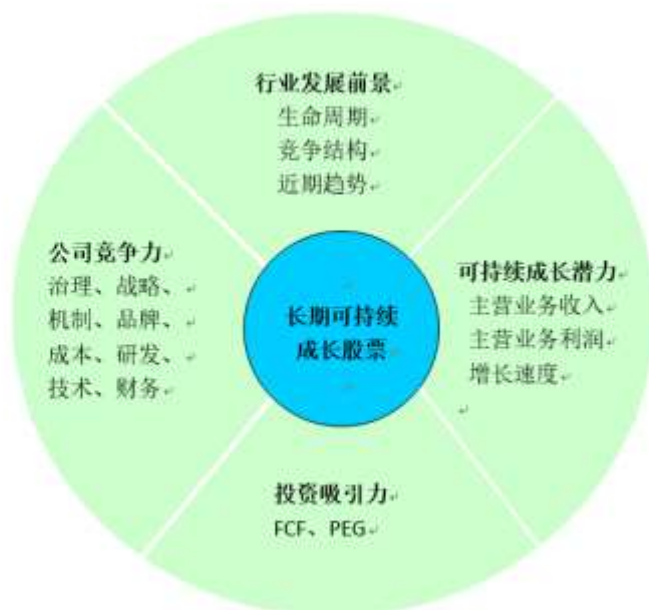
图 1-1 上市公司成长性评价体系