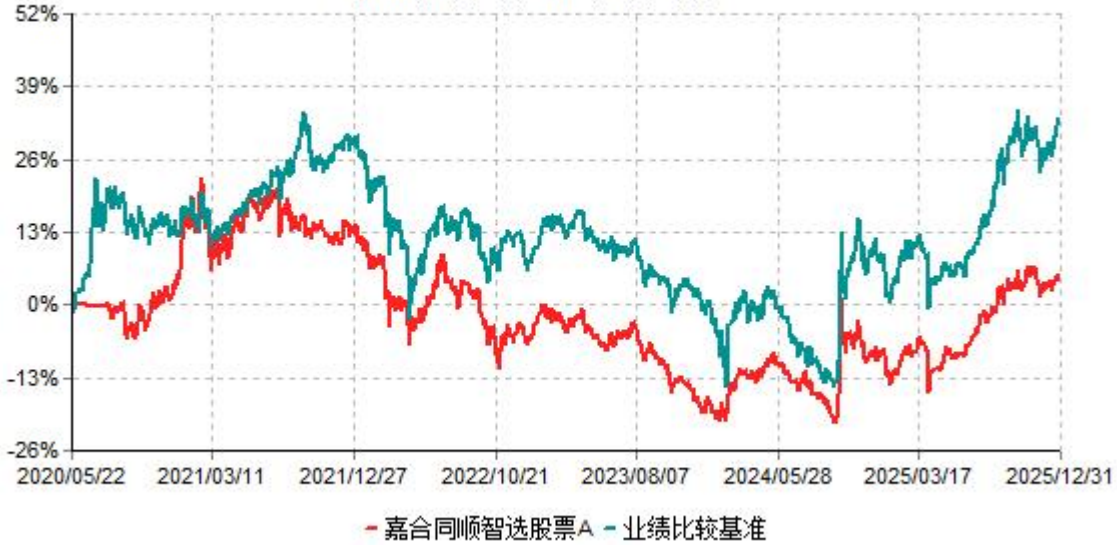
嘉合同顺智选股股票A累计净值增长率与业绩比较基准收益率历史走势对比图 (2020年05月22日-2025年12月31日)