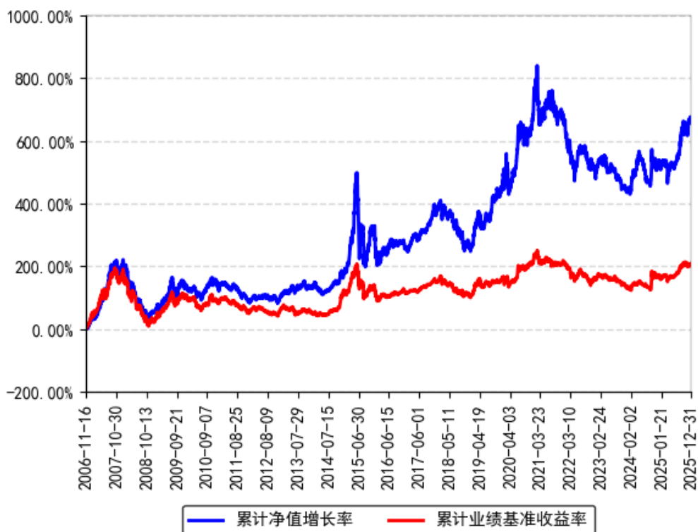
南方绩优成长混合A累计净值增长率与同期业绩比较基准收益率的历史走势对比图