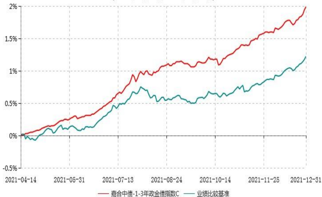
嘉合中债-1-3年政金债指数C累计净值增长率与业绩比较基准收益率历史走势对比图 (2021年04月14日-2021年12月31日)

注：1、本基金合同于 2021 年 04 月 14 日生效，截至报告期末本基金合同生效未满一年。 2、按基金合同规定，本基金自合同生效起 6 个月内为建仓期。建仓期结束时，本基金的各项资产配置比例符合基金合同约定。