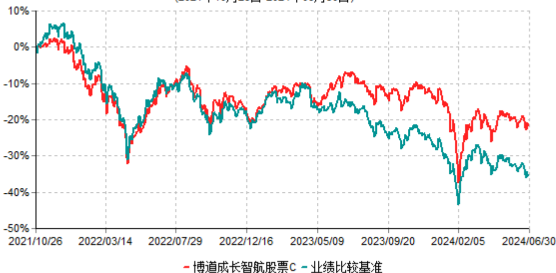
博道成长智航股票C累计净值增长率与业绩比较基准收益率历史走势对比图 (2021年10月26日-2024年06月30日)

注：本基金建仓期为自基金合同生效日起的6个月。截至建仓期结束，本基金各项资产配置比例符合基金合同及招募说明书有关投资比例的约定。