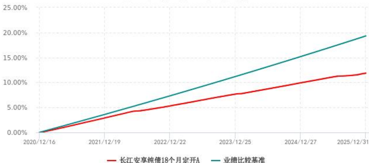
长江安享纯债18个月定开A累计净值增长率与业绩比较基准收益率历史走势对比图 (2020年12月16日-2025年12月31日)