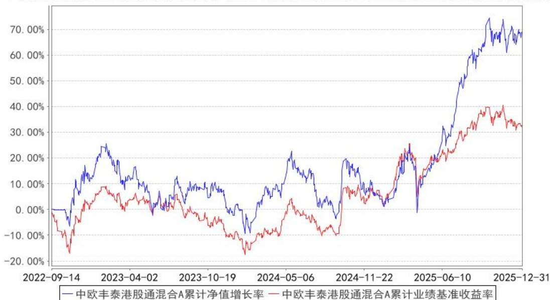
中欧丰泰港股通混合A累计净值增长率与同期业绩比较基准收益率的历史走势对比图