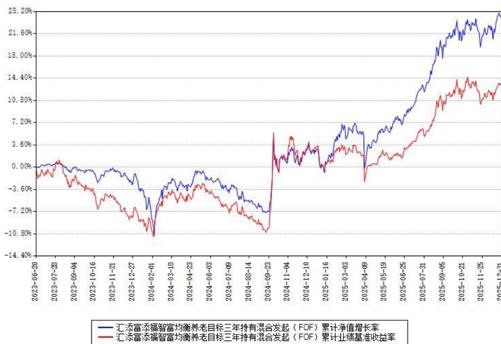
汇添富添福智富均衡养老目标三年持有混合发起（FOF）累计净值增长率与同期业绩比较基准收益率对比图

注：本基金建仓期为本《基金合同》生效之日（2023 年 06 月 20 日）起 6 个月，建仓期结束时各项资产配置比例符合合同约定。