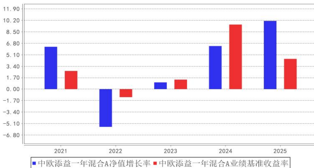
中欧添益一年混合A基金每年净值增长率与同期业绩比较基准收益率的对比图