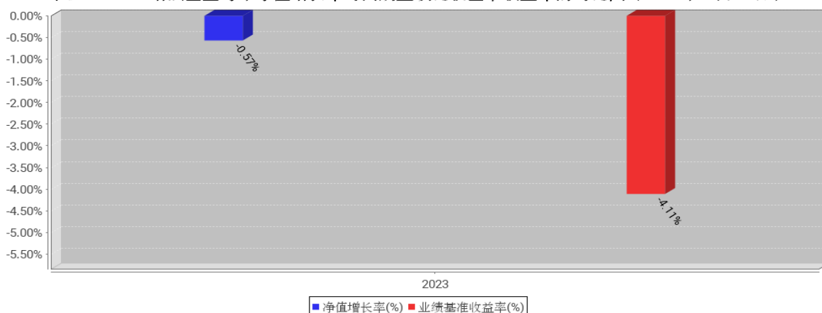
中证1000ETF增强基金每年净值增长率与同期业绩比较基准收益率的对比图（2023年12月31日）

注：1、本基金基金合同于 2023 年 8 月 31 日生效。合同生效当年不满完整自然年度的，按实际期限计算净值增长率。