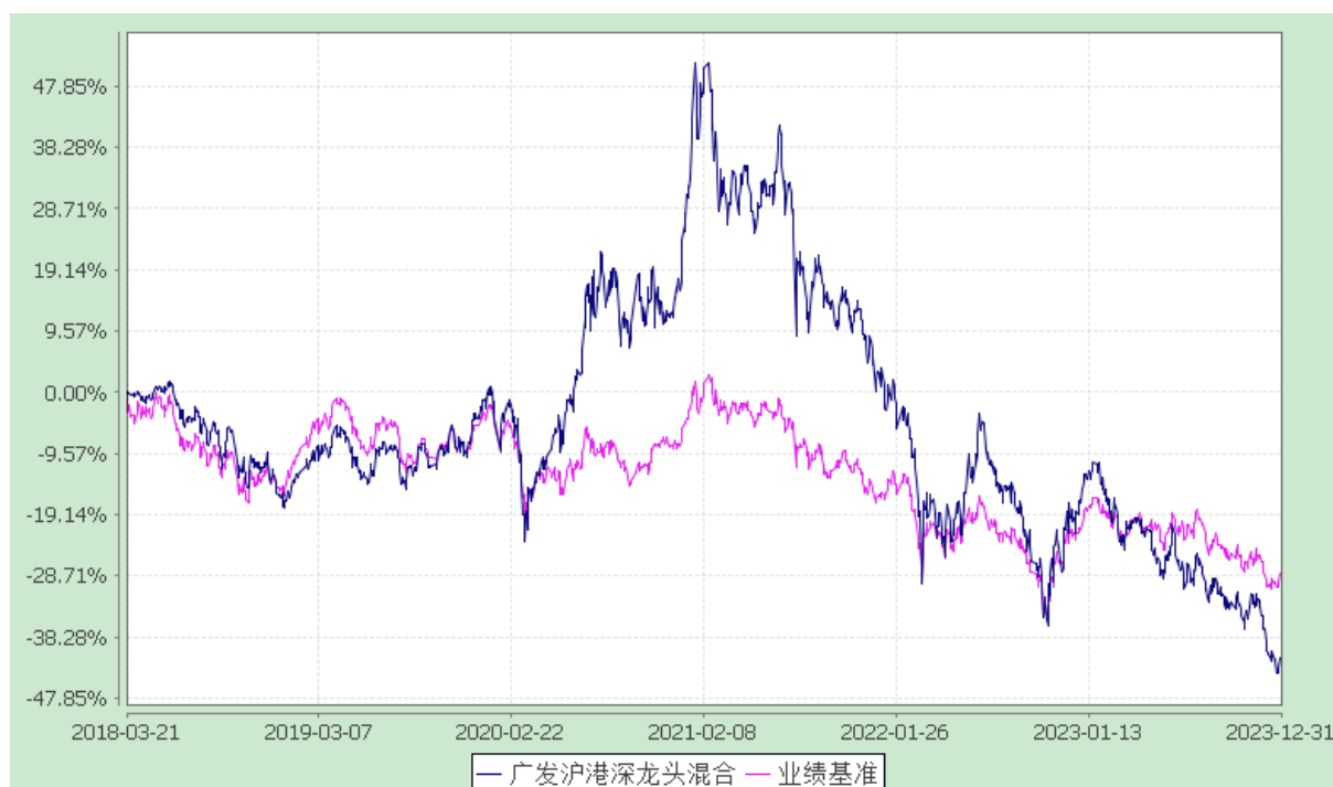
广发沪港深行业龙头混合型证券投资基金 份额累计净值增长率与业绩比较基准收益率的历史走势对比图 (2018 年 3 月 21 日至 2023 年 12 月 31 日)