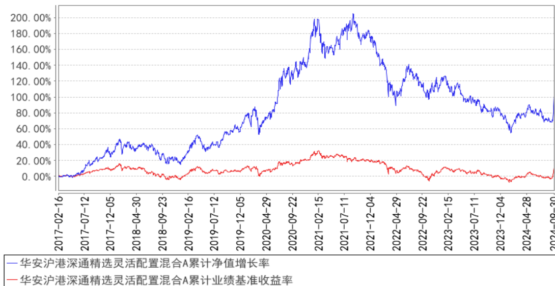
华安沪港深通精选灵活配置混合A累计净值增长率与同期业绩比较基准收益率的历史走势对比图