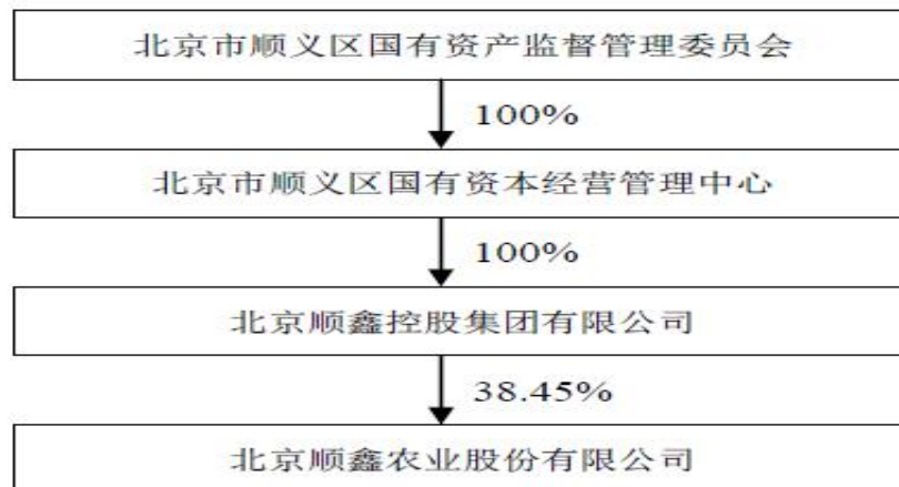
图表 5-5：公司股权结构图

北京顺鑫控股集团有限公司，1994 年 9 月 7 日成立，注册资本为 8.50 亿元主要业务：种植业，养殖业及其产品加工销售；农业技术开发；农业产前、产中、产后服务；销售日用百货，日用杂品，五金，交电，化工，针纺织品。