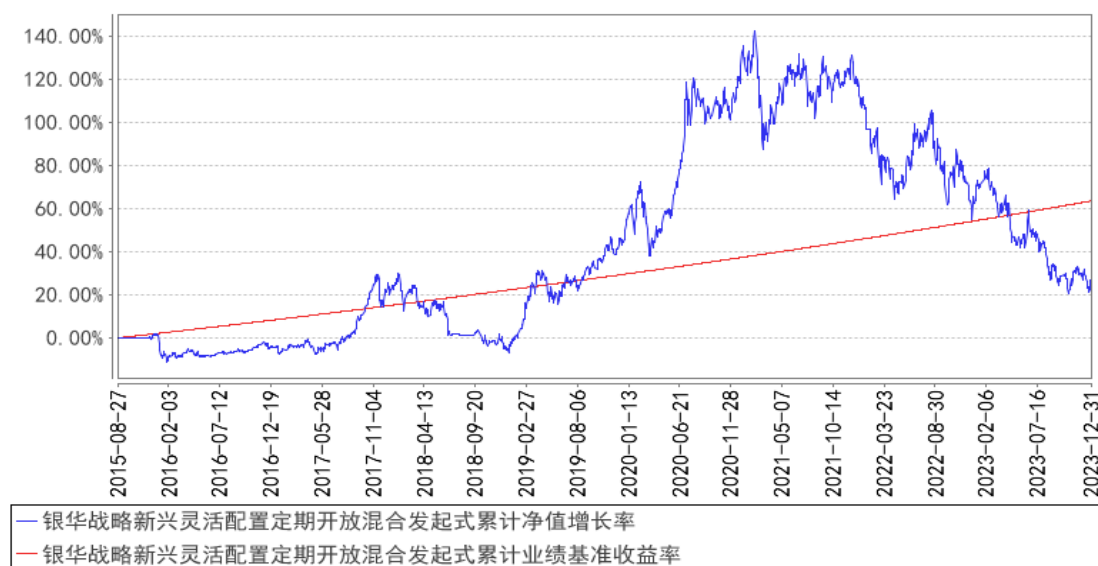
银华战略新兴灵活配置定期开放混合发起式累计净值增长率与同期业绩比较基准收益率的历史走势对比图

注：按基金合同的规定，本基金自基金合同生效起六个月内为建仓期，建仓期结束时本基金的各