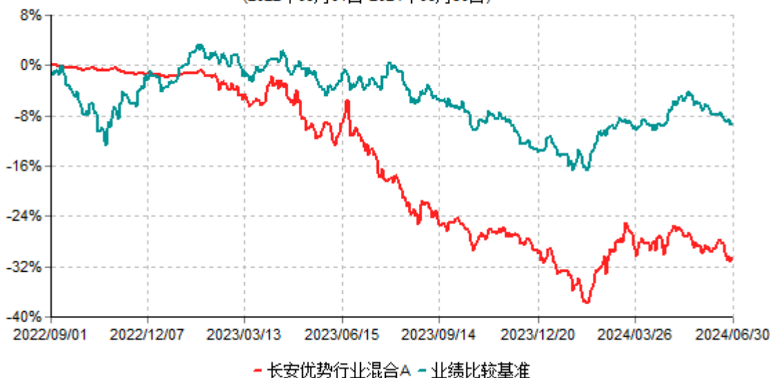
长安优势行业混合A累计净值增长率与业绩比较基准收益率历史走势对比图 (2022年09月01日-2024年06月30日)

根据基金合同的规定,自基金合同生效之日起 6 个月内基金各项资产配置比例需符合基金合同要求。本基金在建仓期结束后,各项资产配置比例已符合基金合同有关投资比例