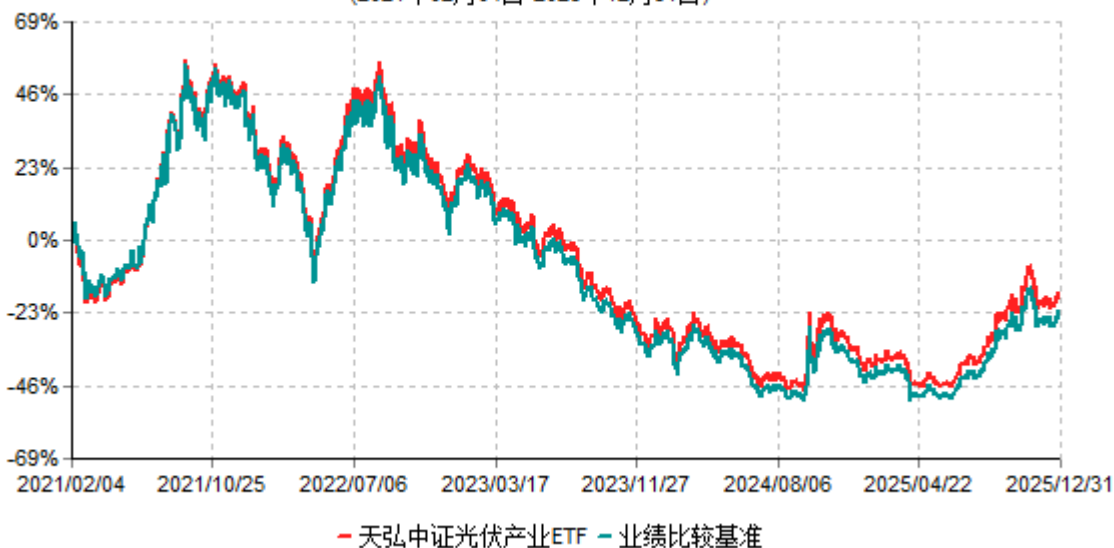
天弘中证光伏产业ETF累计净值增长率与业绩比较基准收益率历史走势对比图 (2021年02月04日-2025年12月31日)

注：1、本基金合同于2021年02月04日生效。 2、本报告期内，本基金的各项投资比例达到基金合同约定的各项比例要求。