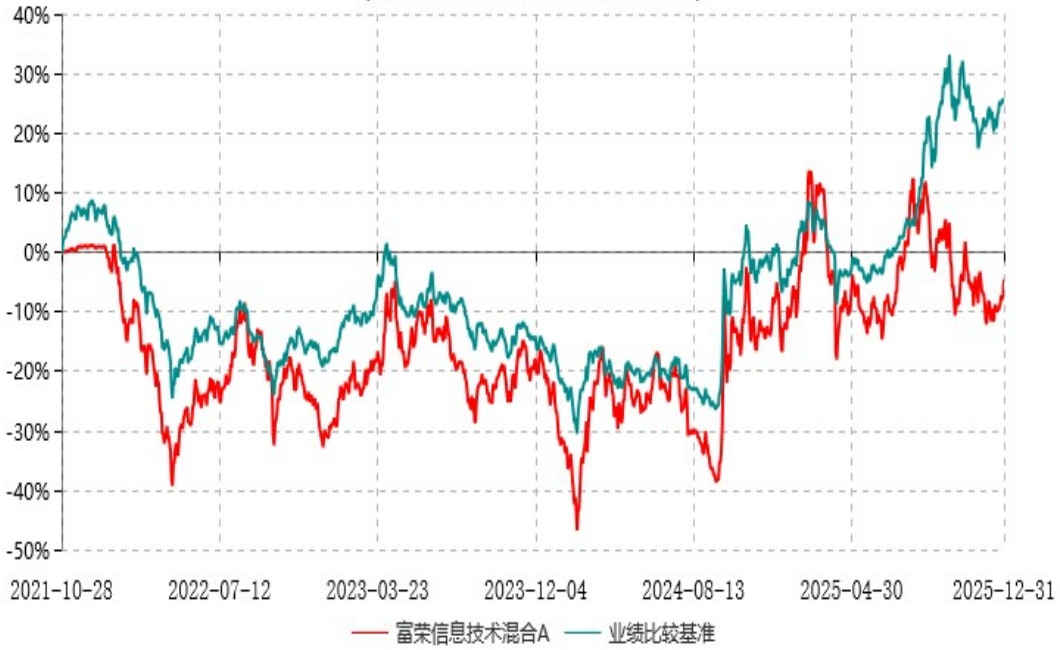
富荣信息技术混合C累计净值增长率与业绩比较基准收益率历史走势对比图