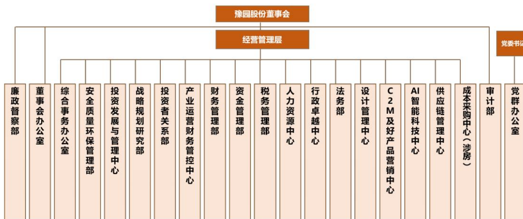
图5-2：公司内部组织结构图