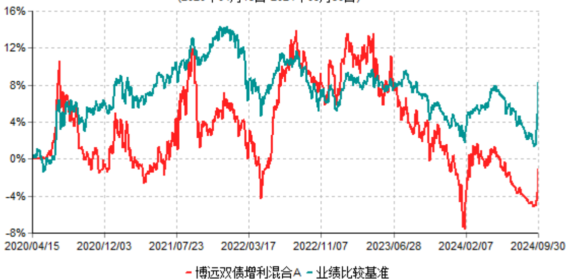
博远双债增利混合A累计净值增长率与业绩比较基准收益率历史走势对比图 (2020年04月15日-2024年09月30日)