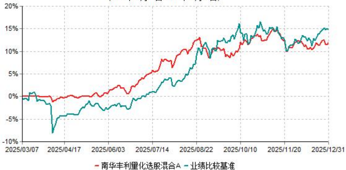
南华丰利量化选股混合A累计净值增长率与业绩比较基准收益率历史走势对比图 (2025年03月07日-2025年12月31日)