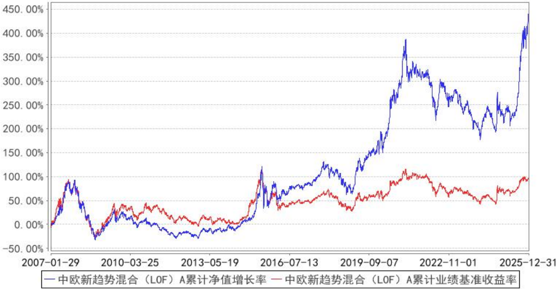
中欧新趋势混合（LOF）A 累计净值增长率与同期业绩比较基准收益率的历史走势对比图