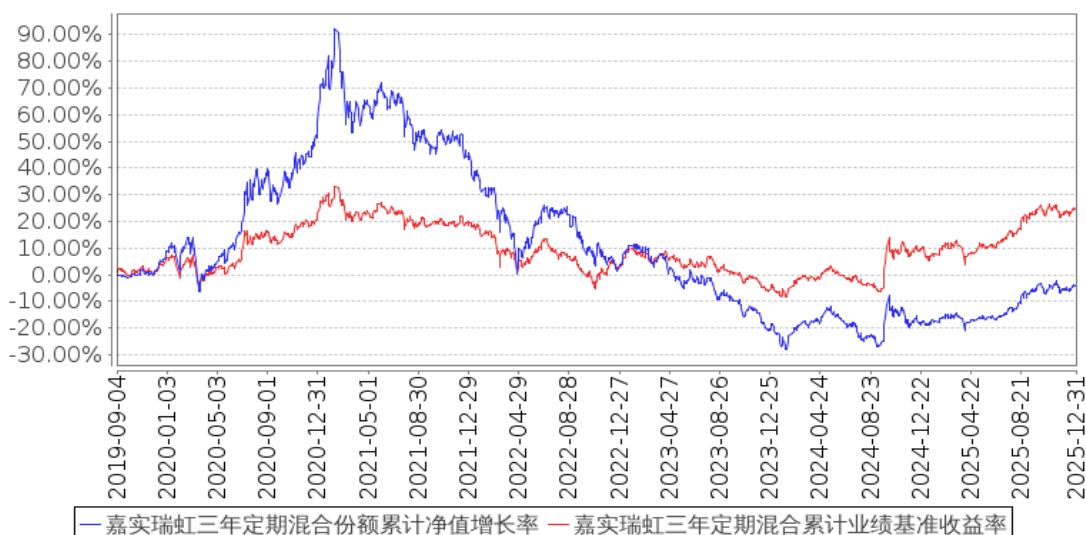
嘉实瑞虹三年定期混合份额累计净值增长率与同期业绩比较基准收益率的历史走势对比图 (2019年09月04日至2025年12月31日)

注：按基金合同和招募说明书的约定，本基金自基金合同生效日起 6 个月为建仓期，建仓期结束时本基金的各项资产配置比例符合基金合同约定。