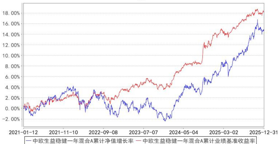
中欧生益稳健一年混合A累计净值增长率与同期业绩比较基准收益率的历史走势对比图