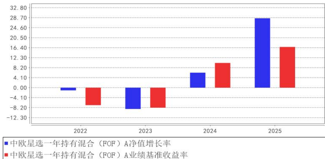
中欧星选一年持有混合（FOF）A基金每年净值增长率与同期业绩比较基准收益率的对比图

注：本基金合同生效日为 2022 年 3 月 24 日，2022 年度数据为 2022 年 3 月 24 日至 2022 年 12 月 31 日数据。