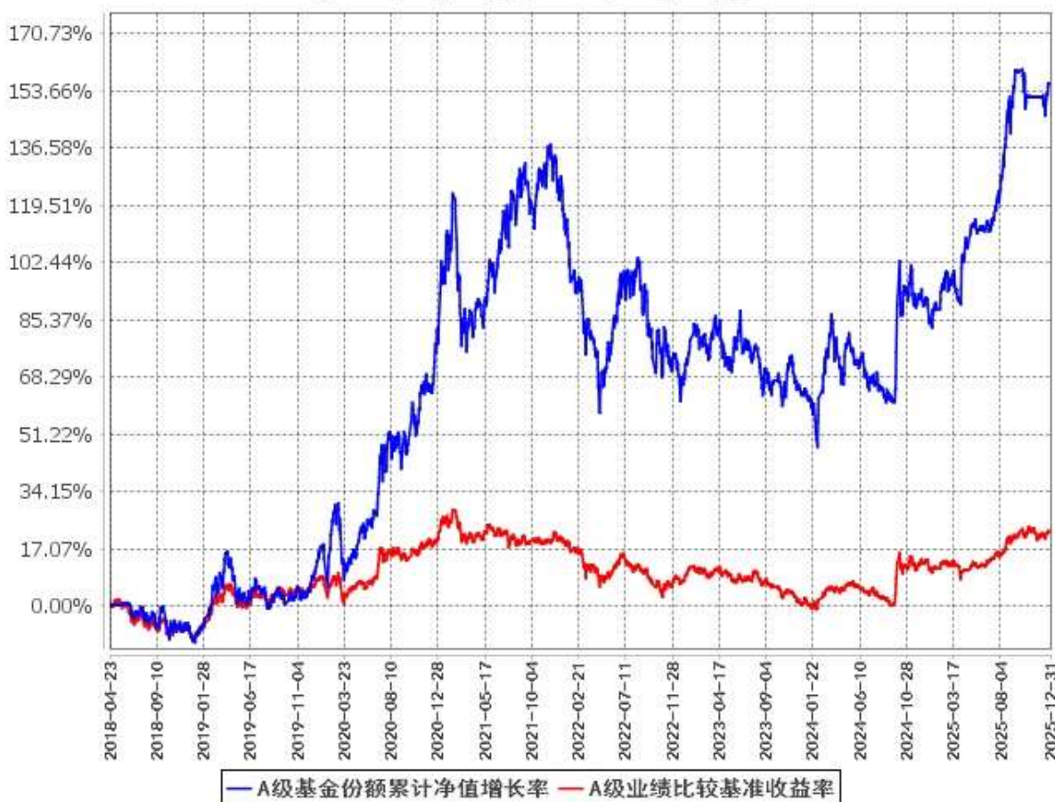
A级基金份额累计净值增长率与同期业绩比较基准收益率的历史走势对比图 (2018年4月23日至2025年12月31日)