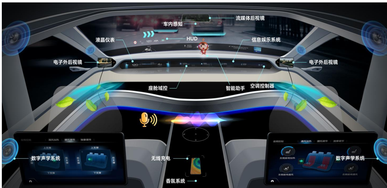
公司汽车电子业务智能座舱产品应用场景示意图

在智能座舱领域，公司坚持以用户体验和使用价值为导向，提供丰富产品的同时，集成软硬件系统和丰富的生态资源，并运用多种创新的人机交互技术，围绕智慧出行、万物互联的应用场景，向客户提供多功能融合的先前的智能座舱解决方案，为用户提供沉浸式的智能座舱体验。