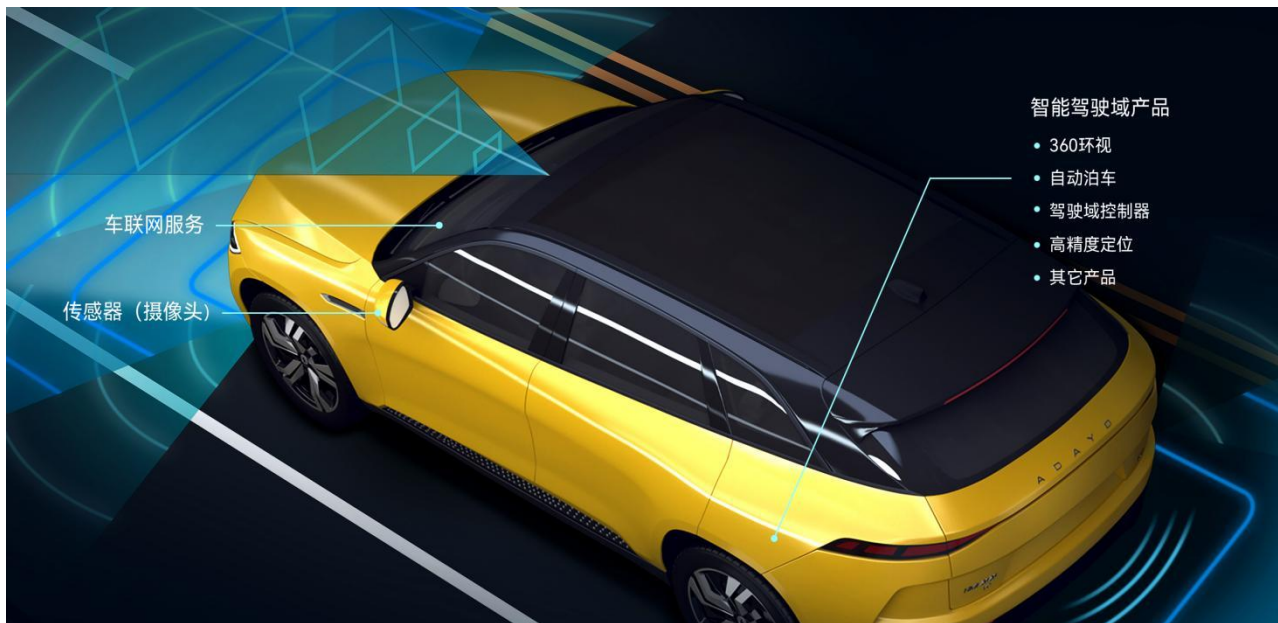
公司汽车电子业务智能驾驶及网联产品应用场景示意图

在智能驾驶领域，公司依托高性能计算平台、多传感器融合、驾驶辅助控制算法以及智能网联技术，从低速（泊车）场景向高速（自动驾驶）场景布局，提供人-车-路-云协同的智能驾驶解决方案，打造安全便捷的用户驾乘体验。