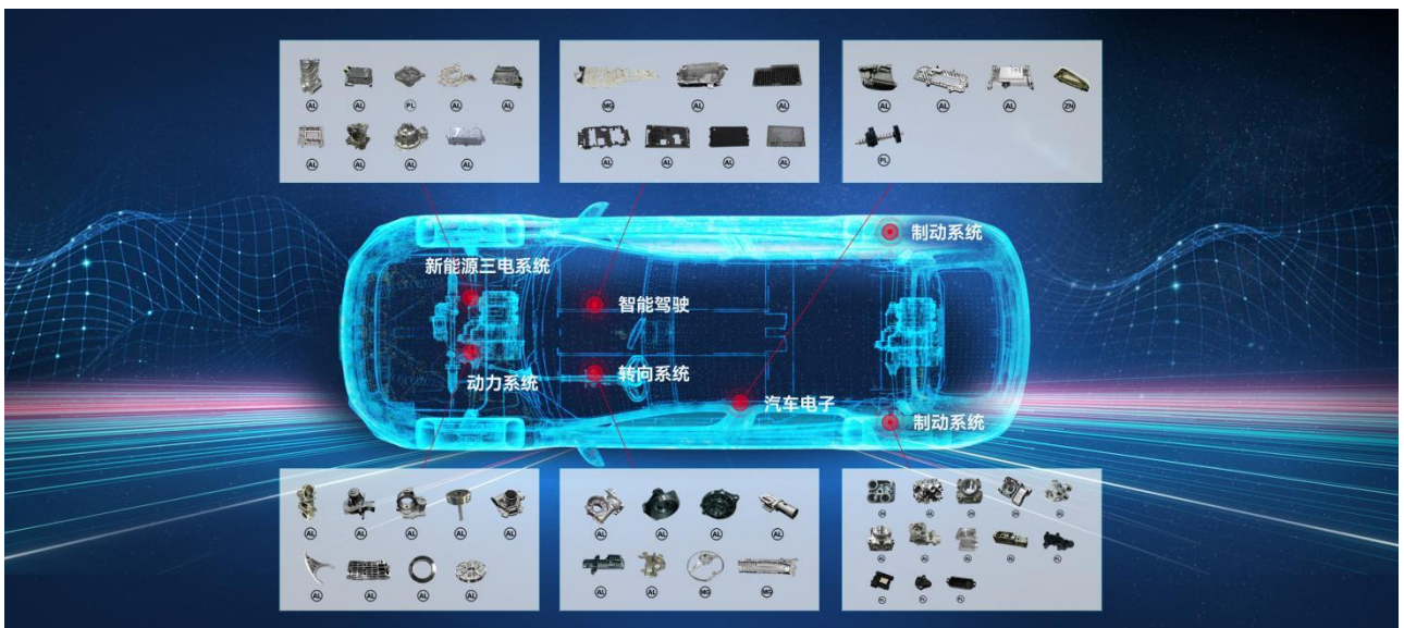
公司精密压铸产品在汽车的应用领域示意图

公司精密压铸业务产品应用领域包括汽车关键零部件、精密 3C 电子部件及工业控制部件等类别。目前以汽车关键零部件产品为主要业务，包括新能源三电系统、动力系统、制动系统、转向系统、热管理系统、智能座舱系统及智能驾驶系统等零部件。