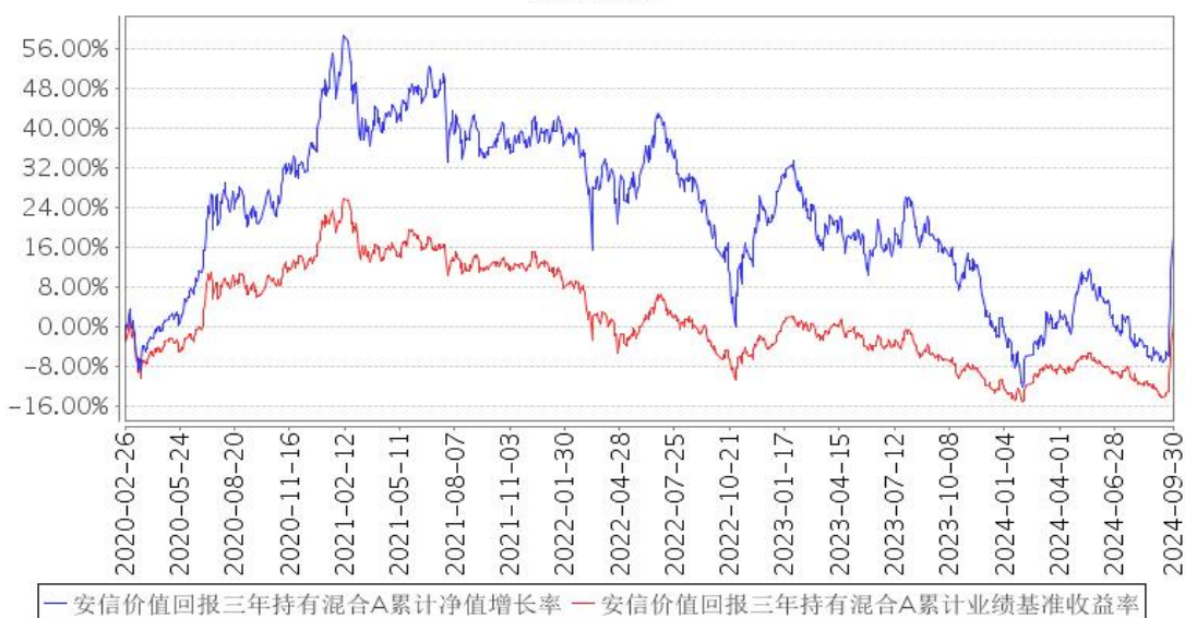
安信价值回报三年持有混合A累计净值增长率与同期业绩比较基准收益率的历史走势对比图