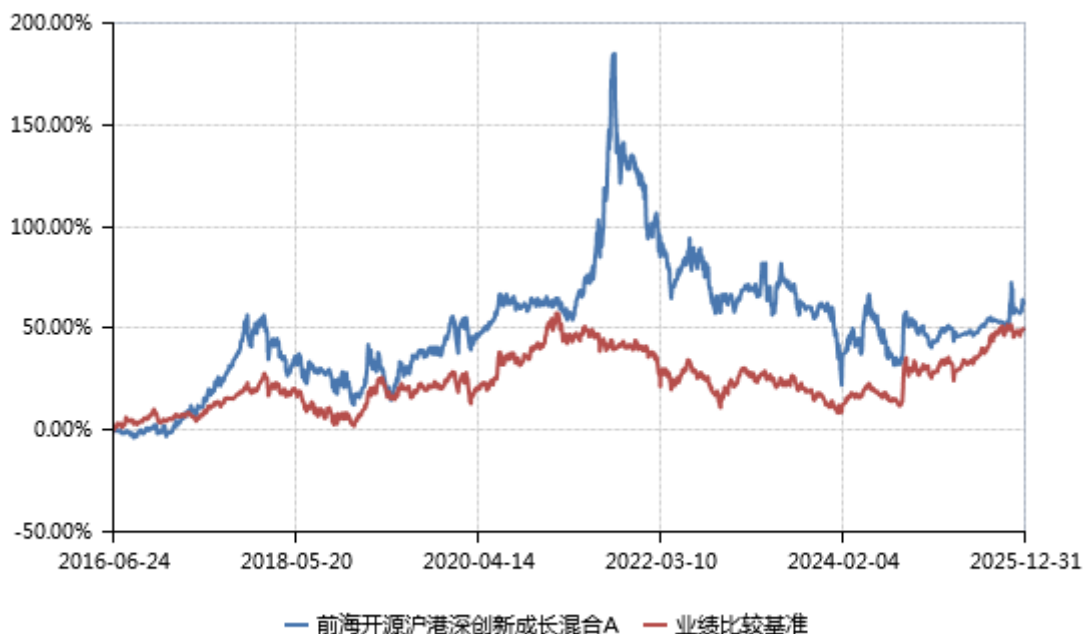
前海开源沪港深创新成长混合 A