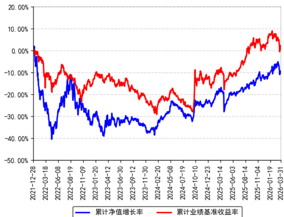
南方产业智选股票A累计净值增长率与同期业绩比较基准收益率的历史走势对比图