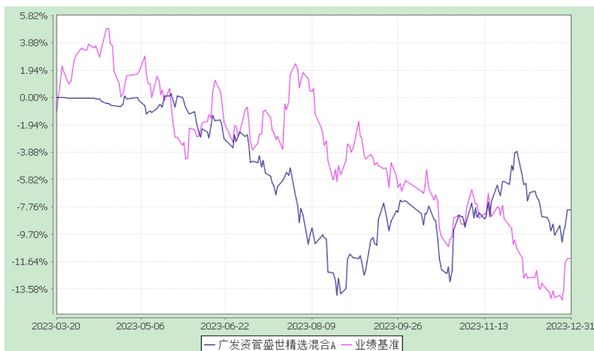
广发资管盛世精选混合 C