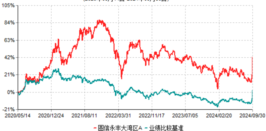
圆信永丰大湾区A累计净值增长率与业绩比较基准收益率历史走势对比图 (2020年05月14日-2024年09月30日)