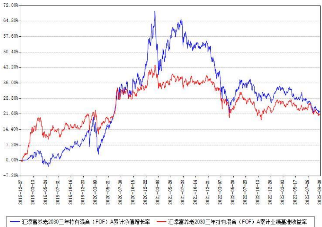
汇添富养老2030三年持有混合（FOF）A累计净值增长率与同期业绩基准收益率对比图

（二）自基金合同生效以来基金累计净值增长率变动及其与同期业绩比较基准收益率变动的比较图