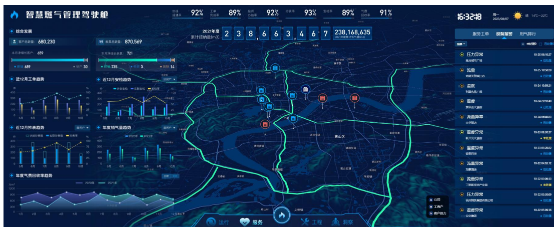
智慧燃气管理驾驶舱