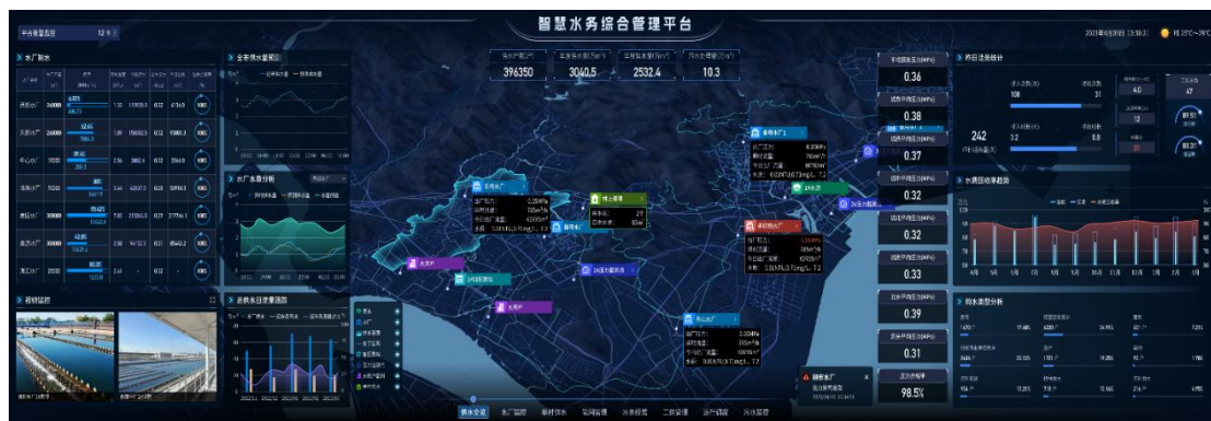
智慧水务综合管理平台

公司数字水务解决方案同样采用云-管-端的服务架构，涵盖水务场景下的智能终端感知、智能网络传输、智能数据采集和智慧业务运营，并一直延伸到 C 端用户的智慧服务。目前公司已经开发了各类民用和工商业智能水务终端，利用机电转换、超声传感和电磁传感等技术产生业务源数据，通过NB-IoT网络将海量业务数据汇集于IoT大数据平台，用于水务企业客户服务、运行调度、漏损治理、数据驾驶舱等各项应用功能。目前数字水务整体解决方案主要包含数字水务一体化整体解决方案、DMA分区漏损控制解决方案、二次供水综合解决方案、农饮水一体化整体解决方案，助力水务企业更高效运营、更科学管理、更优质服务。