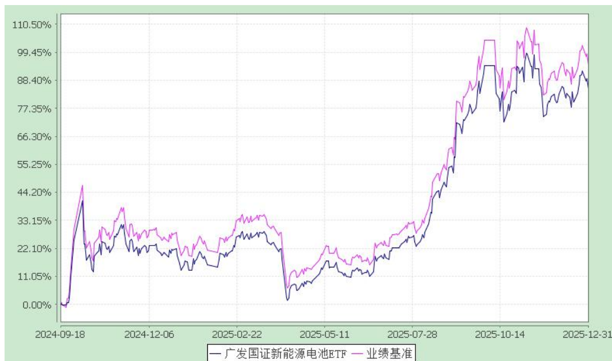
广发国证新能源电池交易型开放式指数证券投资基金 份额累计净值增长率与业绩比较基准收益率的历史走势对比图 (2024 年 9 月 18 日至 2025 年 12 月 31 日)

注：本基金建仓期为基金合同生效后 6 个月，建仓期结束时各项资产配置比例符合本基金合同有关规定。