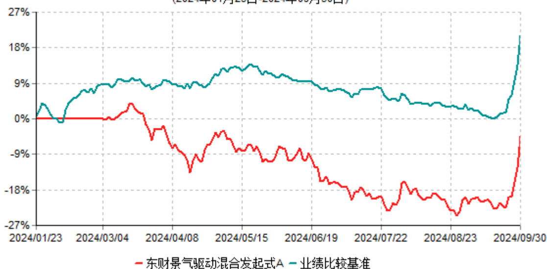
东财景气驱动混合发起式A累计净值增长率与业绩比较基准收益率历史走势对比图 (2024年01月23日-2024年09月30日)