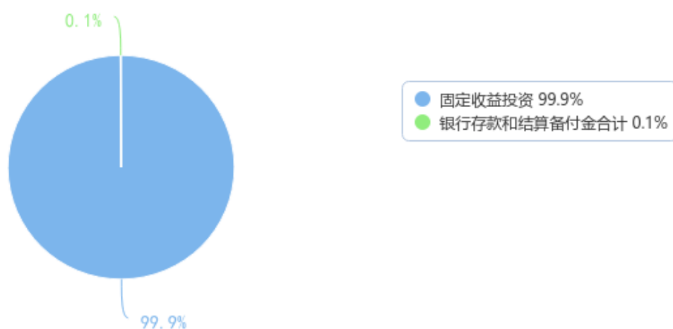
投资组合资产配置图表（数据截至日期：2023年09月30日）